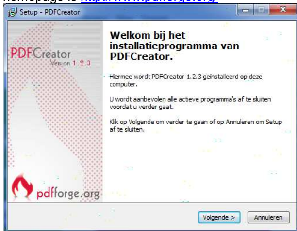
Figuur 1: Welkomspagina ; homepage http://www.pdfforge.org/

Als PDF-Creator is geïnstalleerd kan Qec een PDF-bestandsnaam toekennen aan een PDF. In Qec-Start staan op sheet "printer" hyperlinks naar webpagina's om PDF-Creator te downloaden. De homepage is http://www.pdfforge.org/