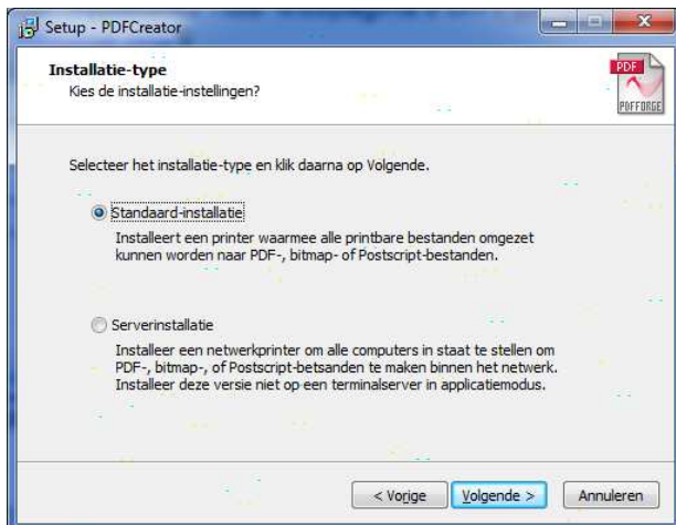
Figuur 2:keuzemenu netwerk(server) of standaard