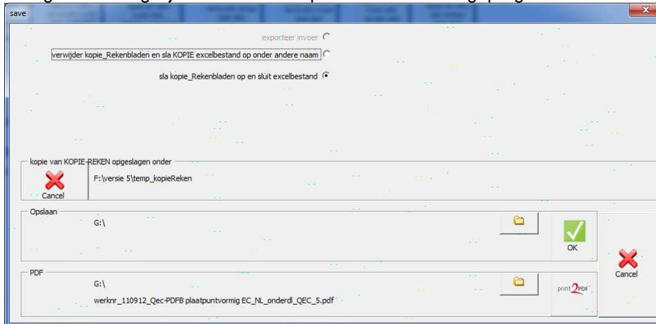
Figuur 3: Mogelijkheid opslaan naar PDF in excel 2003 met geïnstalleerde PDFCreator

Qec geeft de mogelijkheid een PDF op te slaan met voorgeprogrammeerde naam.