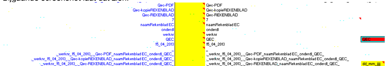
Figure 1: Screenshot bepaling bestandsnamen in start

De gele vakken zijn nu leeg, wat betekent dat margin bij mij niet geopend was en de standaardwaarden van start zelf(hier rechts in zwart) overgenomen worden(links in blauw).